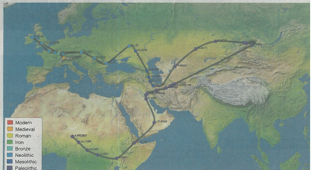
ValaisADN-WallisDNA belegt, über welche Routen Familien ins Wallis kamen.